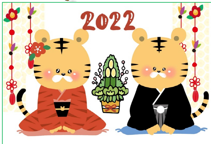
イラスト: おかむらゆみ か 岡村弓華